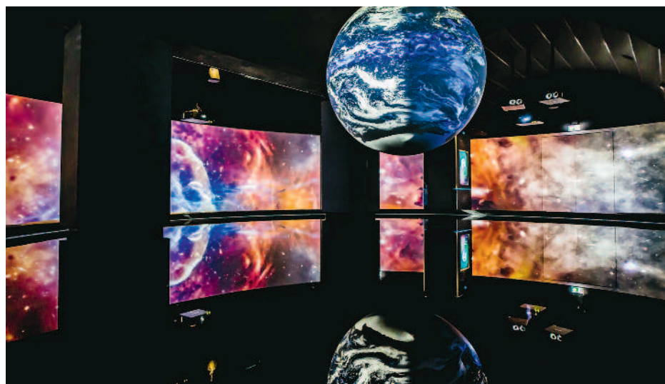
Hydropolis – strefa Planeta Wody

#150latMPWiKWrocław #PijKranówkę #SzanujWodę