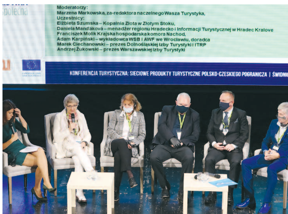
Jedna z debat ubiegłorocznej konferencji w Świdnicy „Sieciowe produkty turystyczne polsko-czeskiego pogranicza”

Projekt podejmuje próbę integracji instytucji i społeczności działających na rzecz turystyki, stworzenia platformy współpracy i stałego porozumienia, bez której zrównoważony rozwój tej dziedziny gospodarki jest bardzo trudny. Potrzeby te zostaną zaspokojone m.in. poprzez cykl transgranicznych spotkań, konferencji, paneli dyskusyjnych, warsztatów i szkoleń oraz organizację Kongresu Turystyki Polsko-Czeskiej. Grupę docelową projektu stanowią mieszkańcy polsko-czeskiego pogranicza, działające na nim podmioty gospodarcze, samorząd terytorialny i gospodarcy, organizacje pozarządowe oraz turyści odwiedzający te regiony. O smakach można mówić długo, szczególnie w gronie osób, które mają świadomość, że biesiada przy stole, na którym królują regionalne i lokalne potrawy i napitki, dla turystyki jest niezwykle ważna, bo przecież wielu z nas uwielbia po-