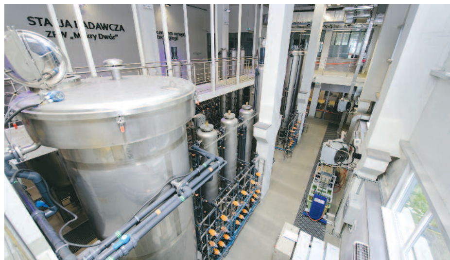
Stacja Badawcza ZPW „Mokry Dwór” – nowoczesna przestrzeń pracy naukowej

Innowacyjne podejście do technologii towarzyszy nam od wielu lat. Szczęśliwym się też,