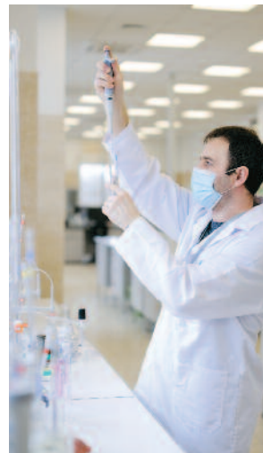
Woda dostarczana do wrocławskich kranów jest bezpieczna, a jej jakość sprawdzana na każdym etapie produkcji i dystrybucji

Okoliczności związane z pandemią zmusiły nas do całkowitego przeorganizowania pracy, tak by uniknąć nawet najmniejszego ryzyka, że nieobecność ludzi wpłynie negatywnie na utrzymanie dostaw wody i odbioru ścieków. Znaczna część pracowników procesu głównego została przegrupowana i podzielona. W obszarach, w których to możliwe, pracujemy również zdalnie, co było nie lada wyzwaniem przy firmie liczącej ponad 700 pracowników, ale zaowocowało tutaj na-