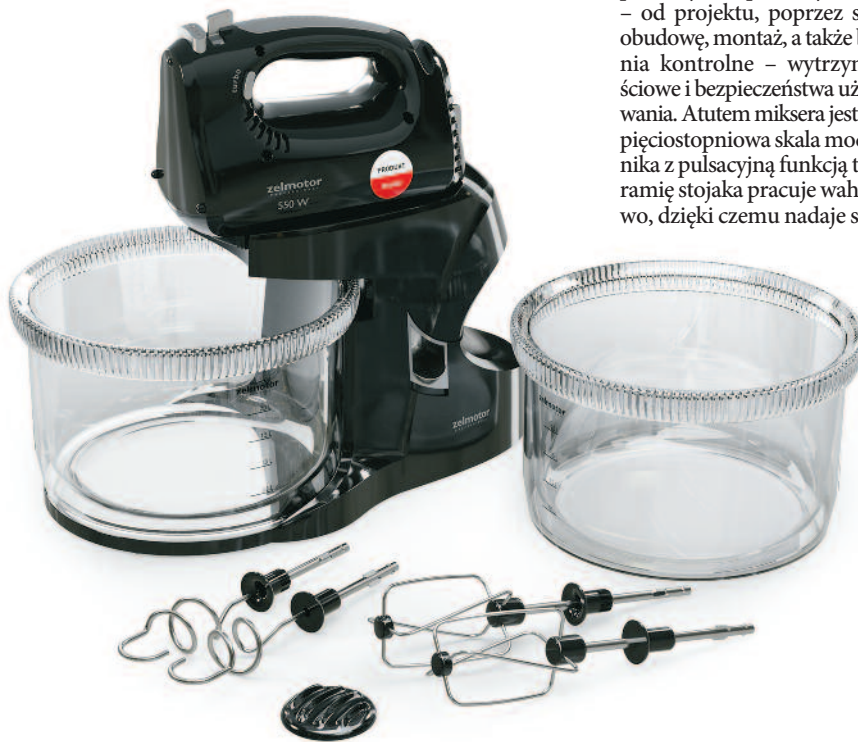
Nagrodzony godłem QI 2021 wielofunkcyjny mikser Zelmotor ze stojakiem i dwiema misami