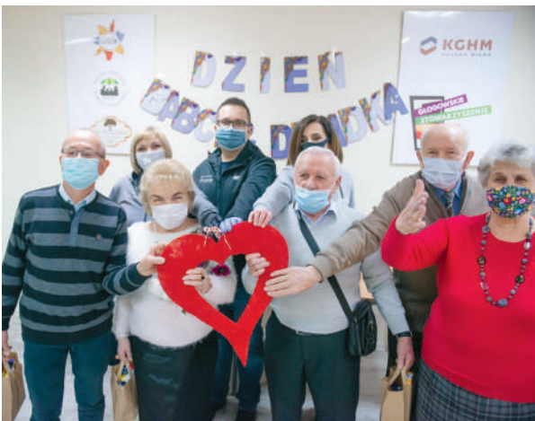
Wolontariusze KGHM przekazujący seniorom paczki podczas pandemii

Działania społeczne KGHM nie byłyby tak skuteczne, gdyby nie współpraca z samorządami, z którymi zarząd spółki regularnie się spotyka, angażując się we wspólne projekty budujące kapitał społeczny. Współ-