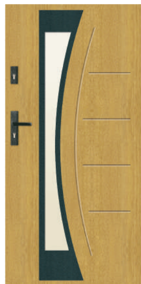
Nowość: drzwi 85 mm T59 S43

Stalprodukt-Zamość jest stabilnym partnerem biznesowym, a zgrany i doświadczony zespół tworzący firmę sprawia, że patrzy ona odważnie w przyszłość, wierząc, że