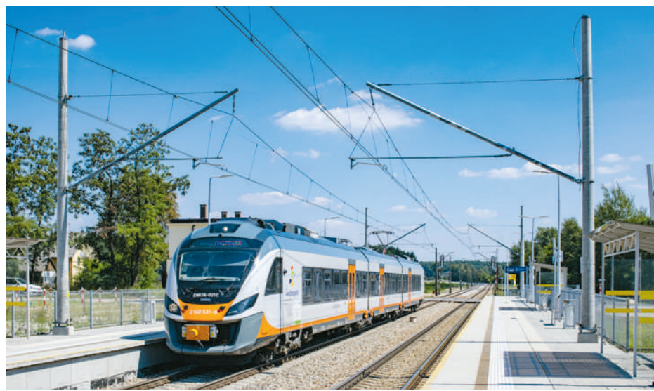
Infrastruktura kolejowa z wykorzystaniem słupów strunobetonowych i kompozytowych

Pragnę zwrócić uwagę, że w tym obszarze bardzo często wymagana jest instalacja pod klucz. Współpracujemy z partnerami biznesowymi oraz z pro-