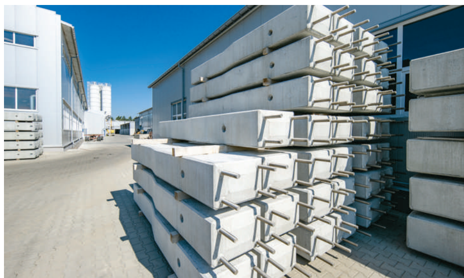
Pale fundamentowe wykorzystywane przy budowie sieci trakcyjnej

odnawialnych źródeł energii, energetyki przemysłowej i telekomunikacji oraz infrastruktury drogowo-kolejowej. Szacujemy, że naszymi wyrobami pokrywamy znaczną część rocznego zapotrzebowania sektora energetycznego kolei. Co nas wyróżnia? Bezdyskusyjnie jest to jakość.