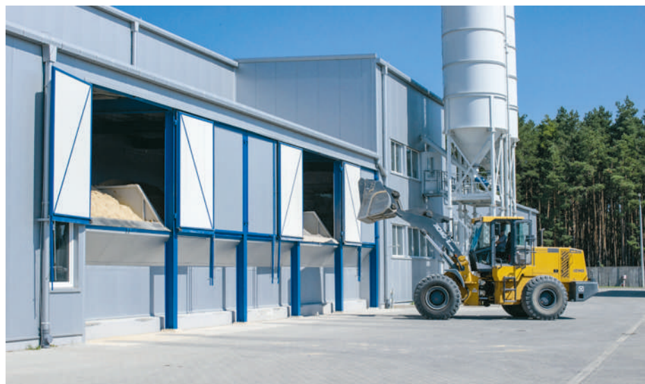
Rozładunek składników betonu

Jak Pan ocenia potencjał dużych, krajowych inwestycji szynowych i energetycznych, jak