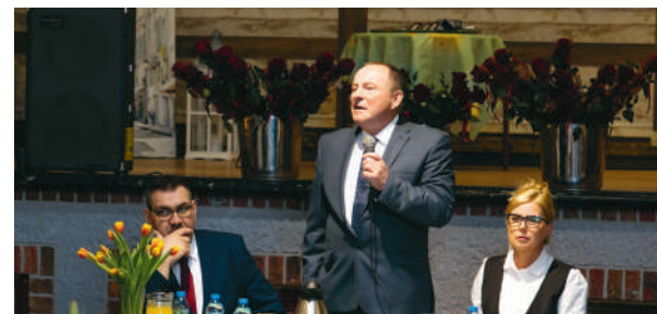
Nowy Zarząd Rolniczego Kombinatu Spółdzielczego w Bądeczu

RKS jest znany w branży z ponadprzeciętnych efektów. To nowoczesnie zarządzane, wielozadaniowe przedsiębiorstwo o zdewersyfikowanej ofercie, nie-