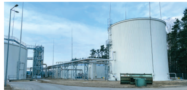
Budowa stopnia beztlenowego oczyszczalni ścieków na terenie Cukrowni Głinojeck

Techbud-Toruń oferuje szeroki zakres prac montażowych nowych instalacji przemysłowych oraz remontów i modernizacji tych istniejących. Co ważne, prowadzone działania nie powodują konieczności zamykania modernizowanych obiektów. Firma duży nacisk kładzie na najnowsze technologie, nieustannie poszerza zakres kompetencji oraz modernizuje zaplecze techniczne. Dzięki temu może jeszcze lepiej spełniać oczekiwania klientów.