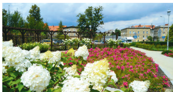
Skwer Śnieżka w Świebodzicach