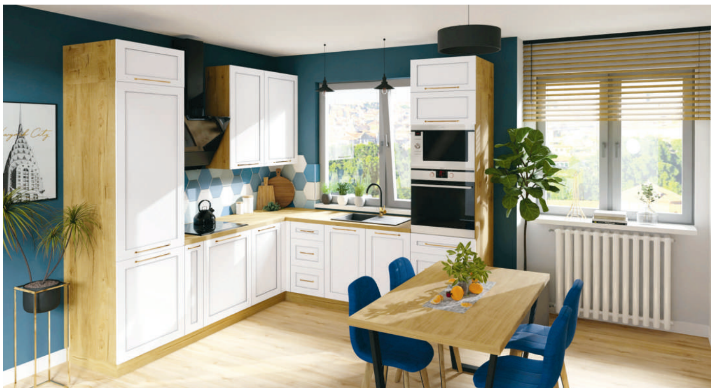
Zestaw mebli kuchennych Laurencia

dować wyłącznie dzięki reklamie i promocji w mediach. To niezwykle ważny element w bieżącej działalności każdego przedsiębiorstwa, ale nie jest on w stanie zastąpić budowania wizerunku firmy po-